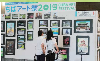
「ちばアート祭2019」の様子

※受賞者には賞状とちば文化資産ゆかりの記念品を差し上げます。 ※応募多数の場合は審査のうえ、展示作品を決定します。(6月下旬予定) ※インスタ部門は受賞作品のみ展示します。